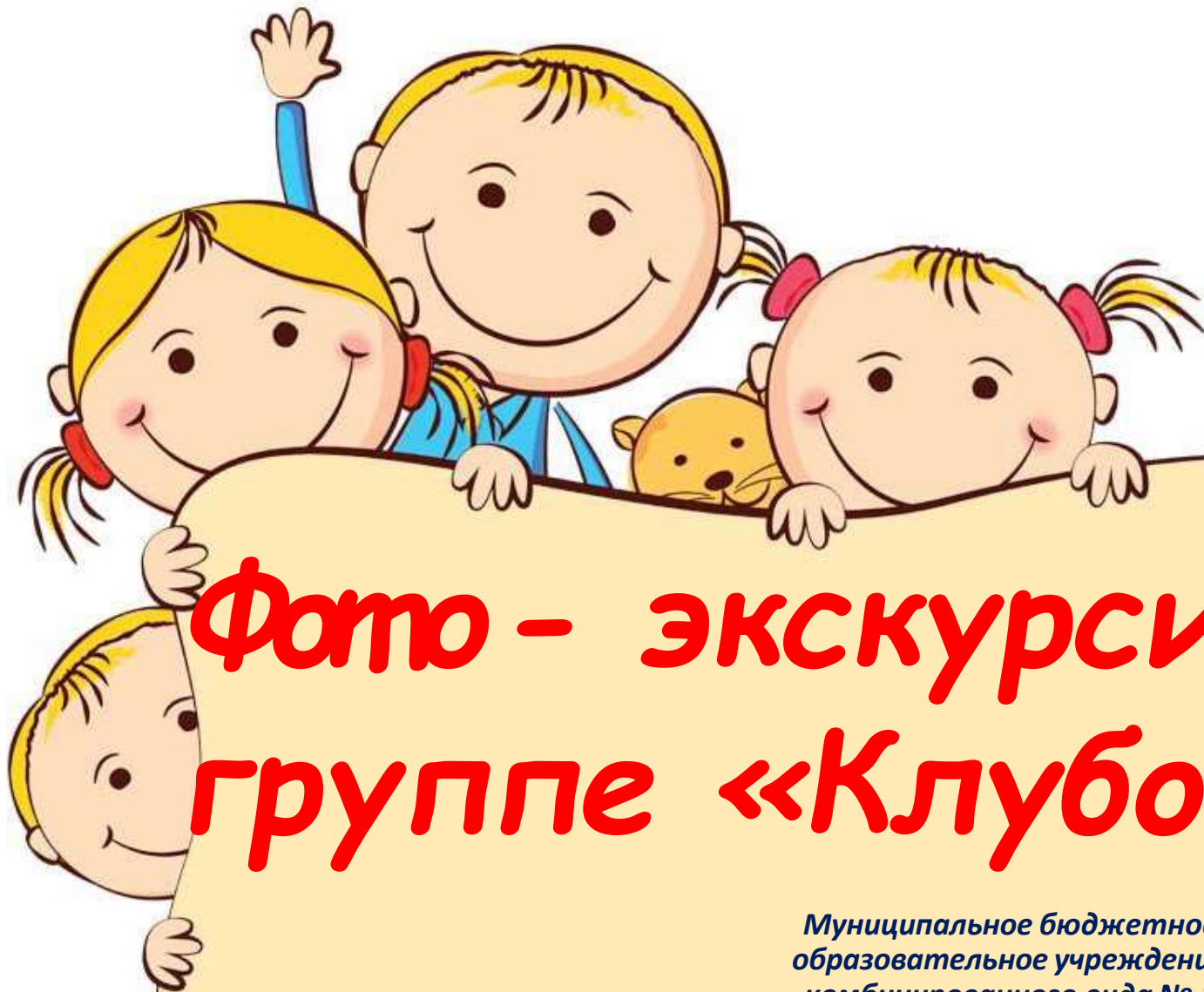
Фото - экскурсия по группе «Клубочки»

Муниципальное бюджетное дошкольное образовательное учреждение детский сад комбинированного вида № 1 «Родничок» Карасукского района Новосибирской области